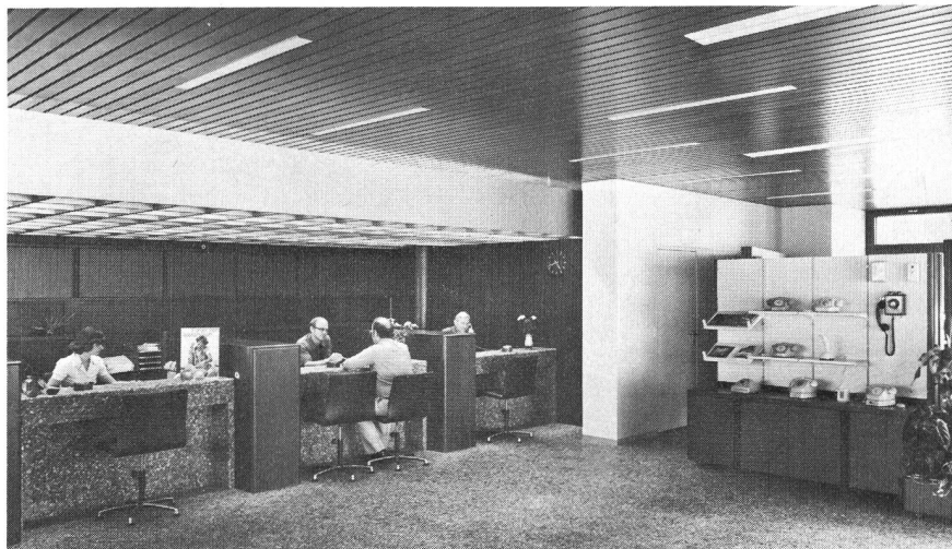
Fig. 2 Informations- und Kundendienstraum

Das Ziel der Tagung besteht in erster Linie darin, in einem Zweijahresturnus ein Forum in Europa für alle in der digitalen Nachrichtentechnik tätigen Fachleute zu schaffen. In diesem Sinne war der diesjährigen Tagung wieder ein voller Erfolg beschieden, indem den insgesamt 41 Vorträgen etwa 600 Teilnehmer (davon 230 aus der Schweiz und 40 aus Übersee) folgten. Die Problemstellung Wechselwirkung zwischen Systemtech-