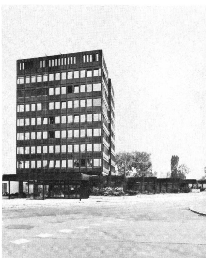
Fig. 1 Das neue Fernmeldegebäude Rapperswil SG mit Verwaltungshochhaus und weitgehend unterirdischem Betriebstrakt

In Zusammenarbeit mit der Stadt Rapperswil konnte das früher offene Gerinne des Stadtbaches eingedeckt werden. Damit entstanden zwischen der Alten Jonastrasse und dem Neubau wertvolle Flächen für Vorplatz und Autoabstellplätze, die Verkehrsübersicht erfuhr eine wesentliche Verbesserung.