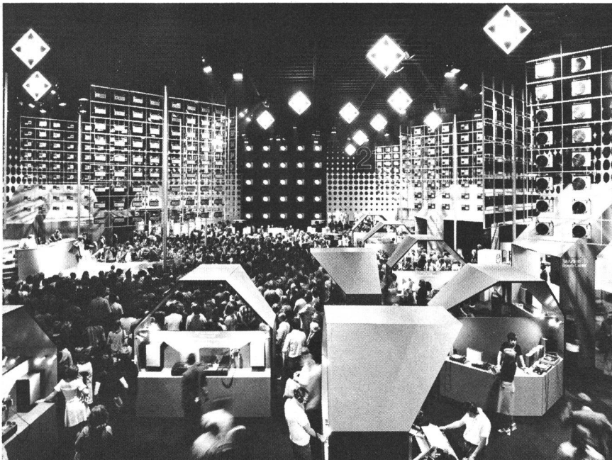
Präsentation an der Internationalen Funkausstellung 1979 in Berlin: Blick in eine der Firmenhallen