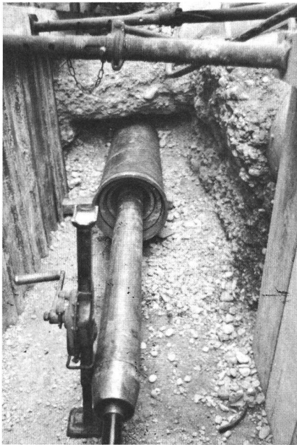
Fig. 6 Rammapparat im Einsatz