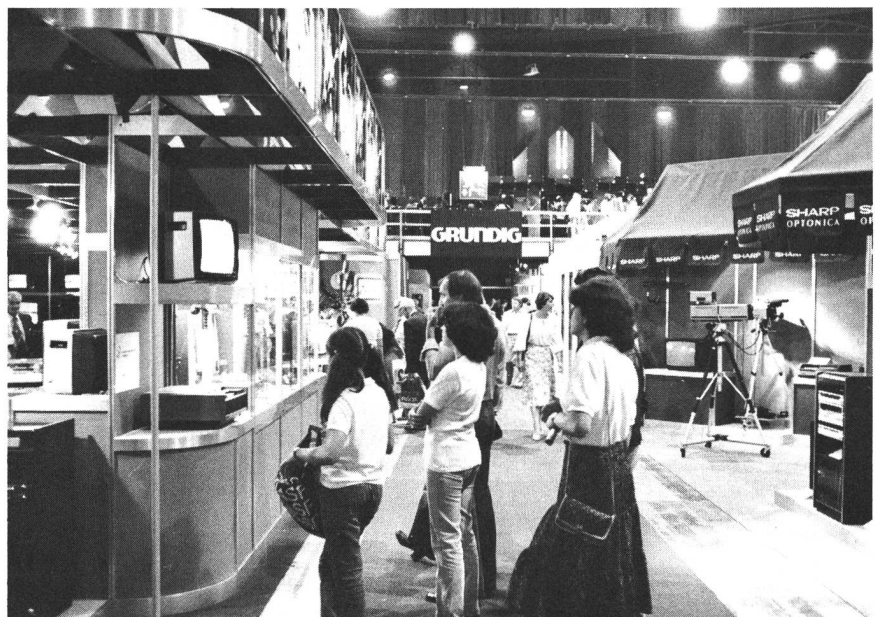
Präsentation an der Schweizerischen Fernseh-, Radio- und HiFi-Ausstellung 1979 in Zürich: Blick in eine der Ausstellungsstrassen mit Ständen verschiedener Firmen

Einleitend meinte er, es sei nicht leicht, über etwas kaum noch Existierendes zu sprechen. Er schilderte die unter protektionistischen Voraussetzungen in den dreissiger Jahren entstandene bescheidene Radioindustrie-Entwicklung in der Schweiz, die sich in den Krisenjahren nur dank Einfuhrkontingentierung und später mit dem «Preisschlüssel» in einer Hochpreisinsel halten konnten. Als dann aber der Direktimport einsetzte, sei Anfang der fünfziger Jahre die ganze Industrie eingegangen, was wegen des damals herrschenden Arbeitskräftemangels leicht habe verschmerzt werden können. Die Schuld gab Studer in erster Linie dem durch künstliche Schranken ausschliesslich auf das Inland beschränkten Absatz. Heute bestche nur noch eine bescheidene Produktion an Telefonrundsprache-Empfängern, und von den Herstellern von