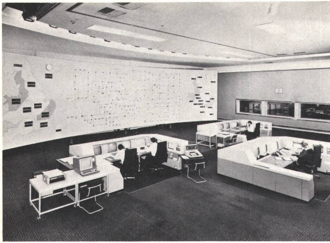
Fig. 2 ... alors que les salles de commande et de répartition d'aujourd'hui ont un aspect bien différent

l'occasion des visites techniques, ont aussi leur importance: Ils permettent de promouvoir l'échange d'informations et d'expérience, tout comme d'en faire un meilleur usage, en jouant le rôle de catalyseur d'idées nouvelles.