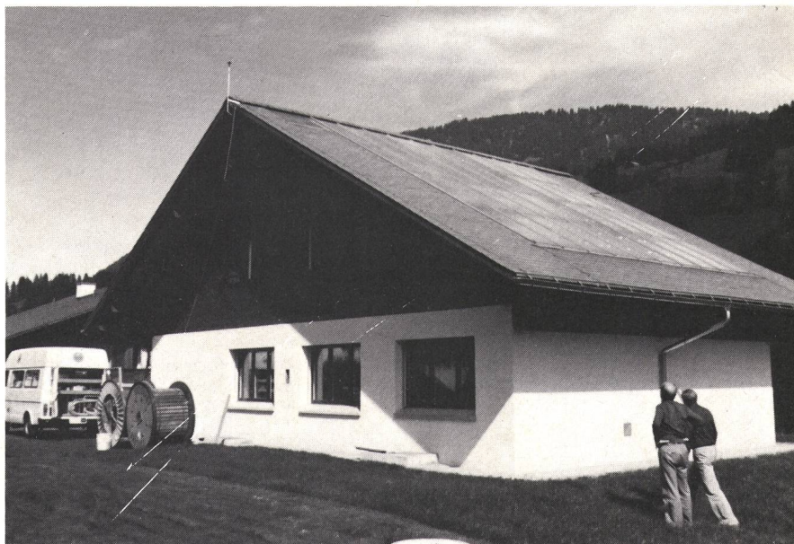
Fig. 1 Zentralengebäude (Typ 1) Feutersoey mit den in die südliche Dachhälfte integrierten Sonnenkollektoren

Von den Grundstück- und Gebäudekosten von 530 000 Franken entfällt ein Grossteil auf die Sonnenenergieanlage. Sie kommt nach den Ausführungen des Vertreters der Hochbauabteilung etwa viermal so teuer zu stehen wie eine einfache Ölzentralheizung. Diese Investition ist natürlich auch bei der möglichen Einsparung von Heizöl nicht innerhalb nützlicher Frist zu amortisieren. Die PTT betrachten diese Pilotanlage aber als einen Beitrag an die Lösung der heute anstehenden Probleme.