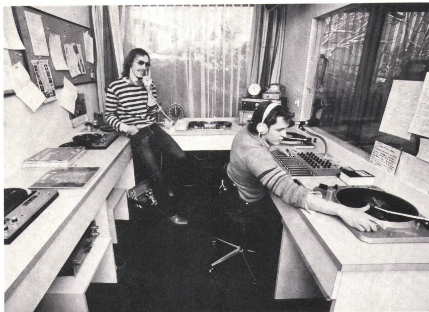
Fig. 1 Die Konzession des Post- und Eisenbahndepartementes gab der Rediffusion das Recht, neben fremden auch eigene Programme zu verbreiten. Zu diesem Zweck verfügt — heute noch — jedes Drahtfunknetz über ein eigenes Studio. Unsere beiden Bilder zeigen oben ein Rediffusion-Studio aus dem Jahre 1940 mit dem Sendepult und der Schallplattensammlung im Hintergrund. Das untere Bild zeigt das heutige Studio in Zürich-Leimbach für das Regionalnetz Zürich

Die Drahtfernsehtetze der Rediffusion sind moderne Breitband-Kommunikationsnetze, die für die Übertragung von 24 Fernsehprogrammen ausgelegt und dadurch zukunftssicher sind, selbst wenn einmal Programme via Satelliten zu empfangen sein werden, auf denen aber auch Neuerungen wie Teletext oder Kabeltext möglich sein werden. Konkrete Pläne hat die Gesellschaft auf den Gebieten der Bildschirm«zeitung» und der Pay-TV (Teletext beziehungsweise Teleclub).