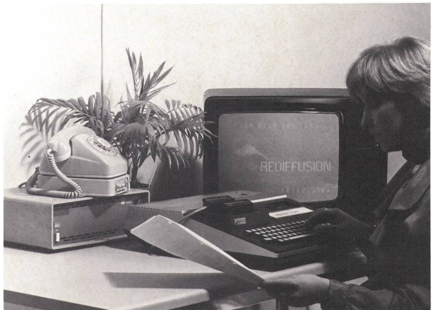
Editierplatz für die «Teleziitig»

Die nördlich des Apparatemagazins der Kreistelefondirektion Biel angrenzenden Liegenschaften wurden seinerzeit von den PTT-Betrieben in der Absicht erworben, dort ein Postverteilzentrum zu erstellen. Auch hier hat die Rezession ihr Veto eingelegt. Dadurch ist es nun der KTD möglich, die beiden Liegenschaften für die seit langem notwendige Neugestaltung und Erweiterung ihres Materialdienstes (neues Apparatemagazin und neuer Kabellagerraum) zu verwenden. Mit den Umbauarbeiten soll noch in diesem Sommer begonnen werden.