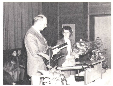
Generaldirektor Trachsel kam nicht mit leeren Händen nach Falera: Er überreichte der Jubilarin ein persönliches Tastenwahltelefon mit Gravur und ein in Leder gebundenes Bündner Telefonbuch mit Widmung (unser Bild). Ferner wird ihr für drei Jahre ein Gratisabonnement erteilt, und sie hat für 200 Franken Gespräche frei

Franken. Weiter erwähnte der Redner den geplanten Bau eines Glasfaser-Ortsnetzes für Breitbandkommunikation in Marsens im Kanton Freiburg. Dies alles diene dem Ziel, die PTT an der Spitze der Fernmeldetechnik zu halten, was für die schweizerische Fernmeldeindustrie von lebenswichtiger Bedeutung sei. Dies bedinge allerdings jährliche Investitionen von vielen Hunderten von Millionen Franken, die wiederum, wenigstens zum Teil, mit den Abonnementstaxen der Teilneh-