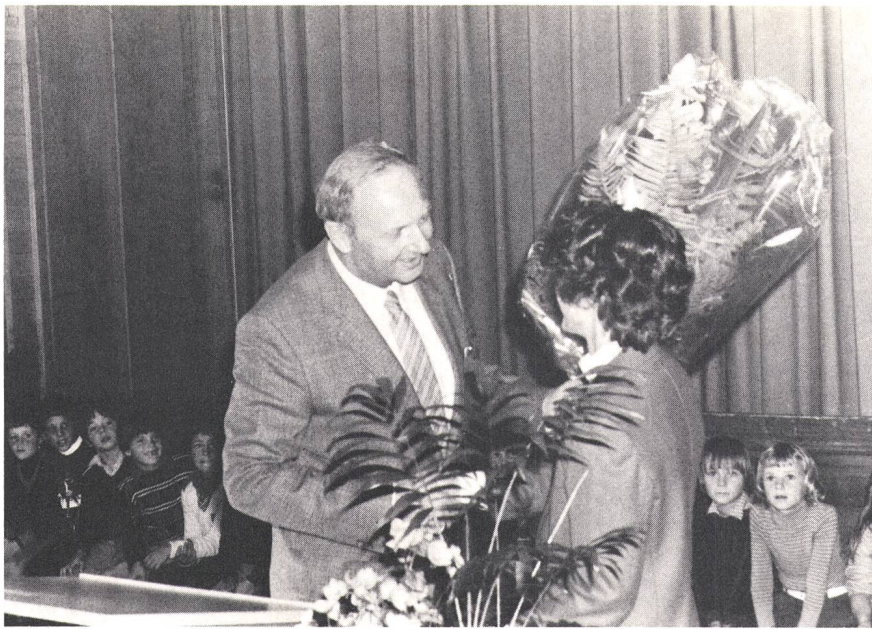
Sichtlich aufmerksam verfolgten die Schüler von Falera die Übergabe der Geschenke an die dreimillionste Telefonabonnentin aus ihrem Dorf