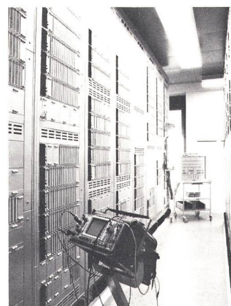
T202-Telexzentrale: Gestellreihe mit Prozessoren

Ein aufschlussreicher Rundgang durch die neuen Anlagen beschloss die Informationskonferenz.