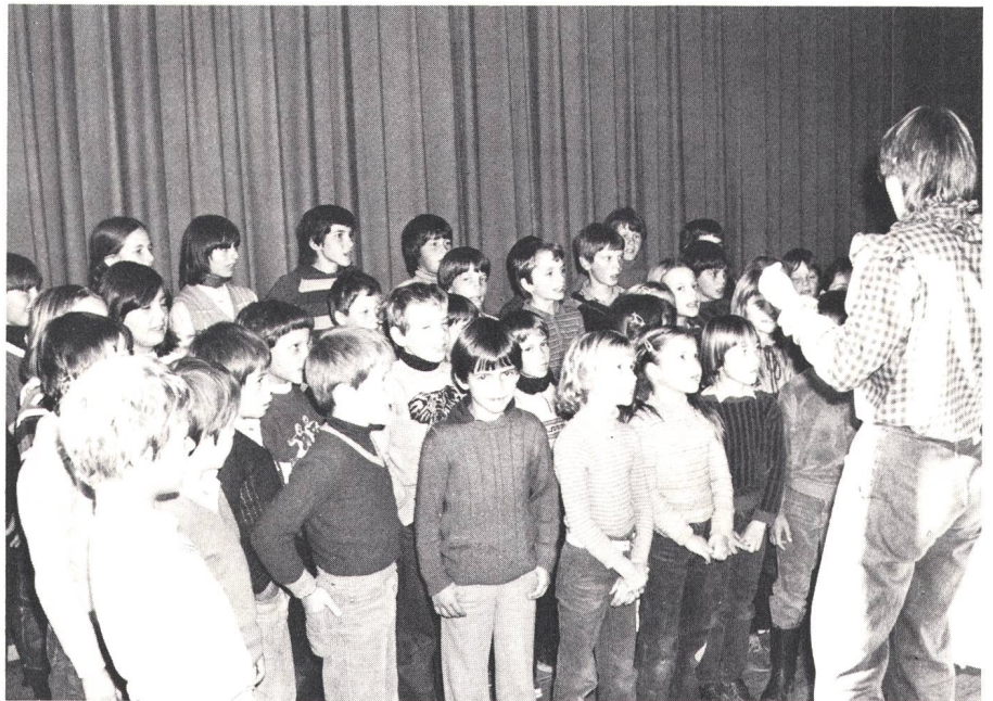
Mit rätoromanischen Liedern umrahmt die fünf Primarschulklassen von Falera unter Frau und Herrn Casutt die Feier des dreimillionsten Teilnehmers

Kunden – und somit auch für die PTT-Betriebe – als Kommunikationsmittel von Mensch zu Mensch nie einbüßen. Im weitem gab Trachsel bekannt, dass die PTT künftig die rätoromanische Sprache