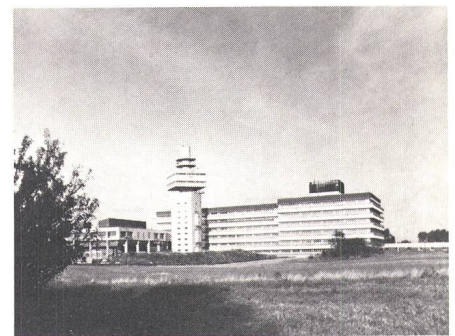
Das Forschungszentrum von British Telecom in Martlesham, Ostengland

Ein grosser Teil dieser Arbeiten hat dazu geführt, dass British Telecom heute eine anerkannte Führungsrolle auf dem Gebiet der optischen Übertragung innehat.