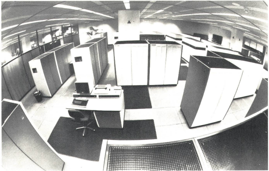
Teilansicht des Produktions-Rechenzentrums. Zurzeit sind 6 Grossrechner installiert. Die auf Disk abgespeicherten Daten würden 670 000 Bundesordner füllen

Zurzeit wird an nicht weniger als 317 – darunter 37 grossen und 120 mittleren – Projekten gearbeitet, so u. a. am Swiss Interbank Clearing System. Beim Weiterausbau geht es auch darum, dem Benutzer zusätzliche Hilfsmittel zur Lösung seiner Anwendungsprobleme und dem Kun-