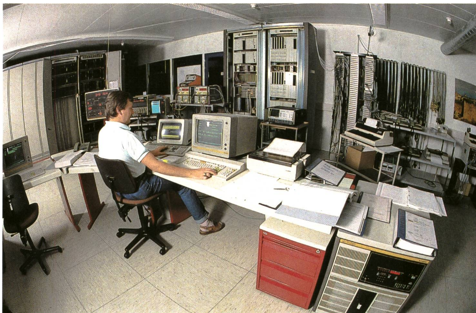
Fig. 1 Ansicht der Modellanlage EWSD Vista dell'impianto modello EWSD

anschliessend Betriebsversuche, die zeigen sollen, ob das System im Feld betriebstauglich ist und in den praktischen Betrieb übergeführt werden kann.