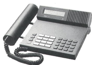
Das formschöne Brigitt 100 mit Lautsprecher, Display und Message-Anzeige für wirtschaftlichen Telefonkomfort.

Für Unternehmer, die mit Teamwork gross werden. Ascoline.