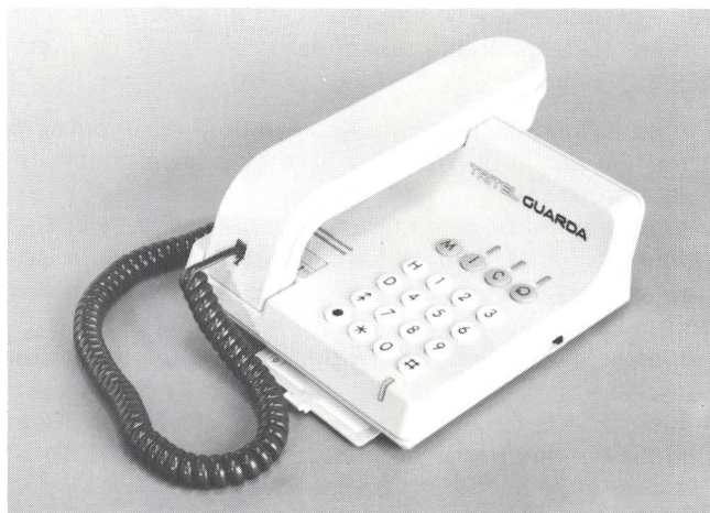
Fig. 2 Tritel Guarda