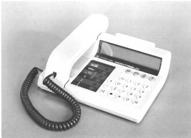
Fig. 3 Tritel Montreux