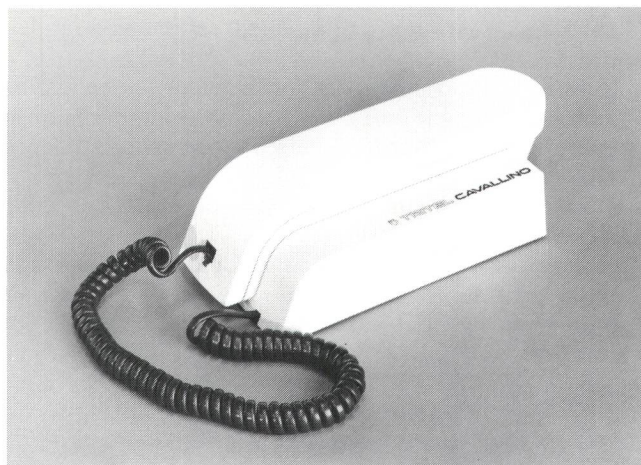
Fig. 4 Tritel Cavallino

La fonction DATA permet de commuter temporairement l'appareil du mode sélection IMP au mode FO. Ceci permet à un appareil branché sur un ancien central public ou d'abonné avec sélection par impulsions de pouvoir, une fois la liaison établie, réaliser certaines fonctions propres au mode FO, à savoir interroger des répondeurs