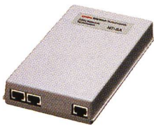
Für den Anschluss von ISDN-Geräten ans EuroISDN/SwissNet: NT-BA, Swiss Telecom Art. Nr. 312.002.9

NT+2a/b vereint die Funktionen eines ISDN-Netzabschlussgerätes und eines Terminaladapters für analoge Geräte. Es können also zum Beispiel bis zu sechs ISDN-Endgeräte, ein Fax Gruppe 3 und ein herkömmliches Schnurlos-Telefon an das gleiche Gerät angeschlossen werden. Ihr Benefit: Betriebliche Vereinfachungen verbunden mit signifikanten Kostenvorteilen.