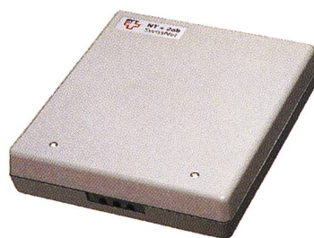
Für den Anschluss von ISDN- und Analog-Geräten ans Euro-ISDN/SwissNet: NT+2a/b, Swiss Telecom Art.Nr 212.016.0