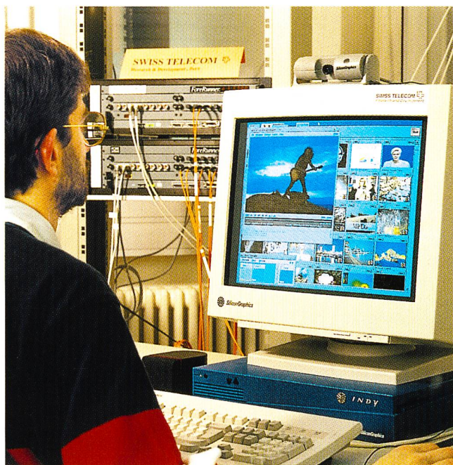
Richiamo di immagini tramite ATM