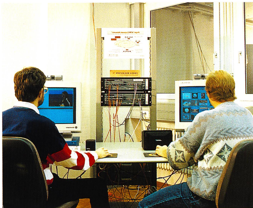
Vista parziale del laboratorio ATM Corporate Network

sono di primaria importanza in un ambiente LAN ATM. La necessità di stabilire, tramite la gestione di rete, collegamenti virtuali fissi (PVC) statici fra stazioni di lavoro e server rende il sistema assai poco flessibile. Attualmente sono collegate alla parte svizzera della piattaforma ATM Corporate Networks circa 15 stazioni di lavoro e server, tutti comunicanti fra di loro. Senza collegamenti virtuali commutati (SVC) sarebbe stato necessario attuare più di 200 PVC unidirezionali! I commutatori LAN ATM (Fore Systems) scelti per la parte svizzera di questo progetto supportano SVC.