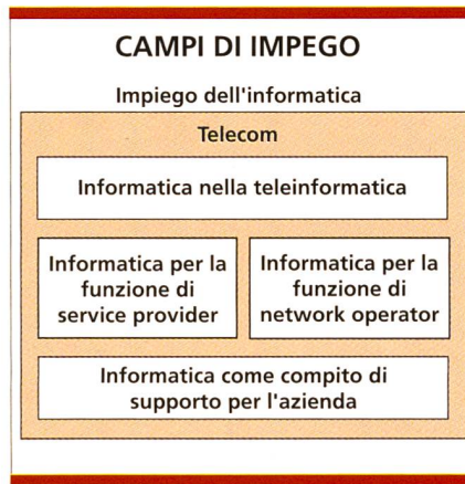
Fig. 2. Campi di impiego dell'informatica di una Telecom.

spetto all'azienda ed ai settori di attività