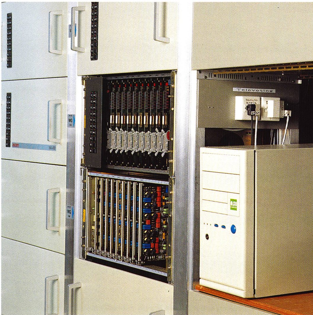
Bild 6. TeleVote-Sammelstelle.

fer der Dienstnummer (TeleVote: 151, Weckdienst: 150). Nach einer Kontrolle der Abstimmtdaten auf Vollständigkeit und Gültigkeit gelangen sie zur weiteren Verarbeitung in die TeleVote-Sammelstelle. Am Ende der Datenübertragung veranlasst der Eingabesatz die Taxierung und schaltet danach den Quittungstext «Ihr Anruf wurde gezählt» auf die Leitung. Wenn der Teilnehmer nicht sofort auflegt, erfolgt eine Rückwärtsauslösung.