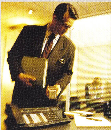
Kommunikationsarbeitsplatz Alcatel 4075.

Alcatel 4000 ist eine Gesamtlösung für die Kommunikation in einem Unternehmen. Professionelle Kommunikation und einfachste Bedienung sind kein Widerspruch mehr: