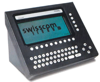
Bild 1. Teleguide®, das elektronische Telefonbuch entwickelt sich zu einer multifunktionalen Kommunikationsplattform.

gewählten Dienst zwischen 70 und 240 Zeichen. Teleguide® weist den Kunden darauf hin, sobald die maximale Meldungslänge ausgeschöpft ist. Nach Versenden der Meldung wird die entsprechende Gebühr durch die Publifon-funktionalitäten dem Konto des verwendeten Zahlungsmittels belastet. Die Taxierung basiert auf einer pro Nachrichten-