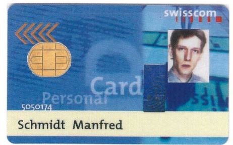
Bild 4. Mögliche Anwendung: Smart Card als Personal Card Swisscom.

vorgelegt [4]. Zwei Jahre danach stellten R.L. Rivest, A. Shamir und L. Adleman einen solchen Algorithmus vor, der nach seinen Erfindern benannt (RSA-Algorithmus) und bis heute das verbreitetste Verfahren dieser Art ist. Dabei verfügt jeder Benutzer über ein Schlüsselpaar, von dem einer, der Public Key, öffentlich bekannt ist – etwa durch Hinterlegung in einem öffentlich lesbaren Verzeichnis –, während der zweite, der Private Key, geheim bleibt. Nachrichten, die mit einem der beiden verschlüsselt worden sind, können nur mit dem passenden Gegenstück entschlüsselt werden. Dieser Ansatz eröffnet die Möglichkeit der eindeutigen Identifikation des Empfängers oder des Absenders einer verschlüsselten Nachricht. Im ersten Fall wird eine Nachricht mit dem Public Key des beabsichtigten Empfängers chiffriert, sodass nur der Besitzer des zugehörigen Private Keys die Nachricht entschlüsseln kann. Diese Funktion entspricht der eines Briefkastens mit Schloss: Jeder kann einen Brief einwerfen, aber nur der Inhaber des Schlüssels kann die Nachrichten lesen. Im zweiten Fall wird die Nachricht mit dem Private Key des Absenders verschlüsselt. Jeder Empfänger kann diese Nachricht mit dem Public Key entschlüsseln und so den Absender identifizieren. Diese Funktion entspricht einem verschlossenen Schaukasten: Jeder kann den Inhalt sehen, aber nur der Eigentü-