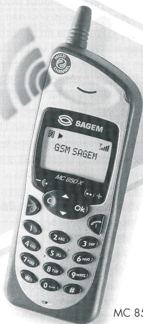
MC 850 X

Speziell für Mithörer! Die Freisprecheinrichtung des Sagem MC 850 erlaubt auf Wunsch das Mithören über einen eingebauten Lautsprecher.