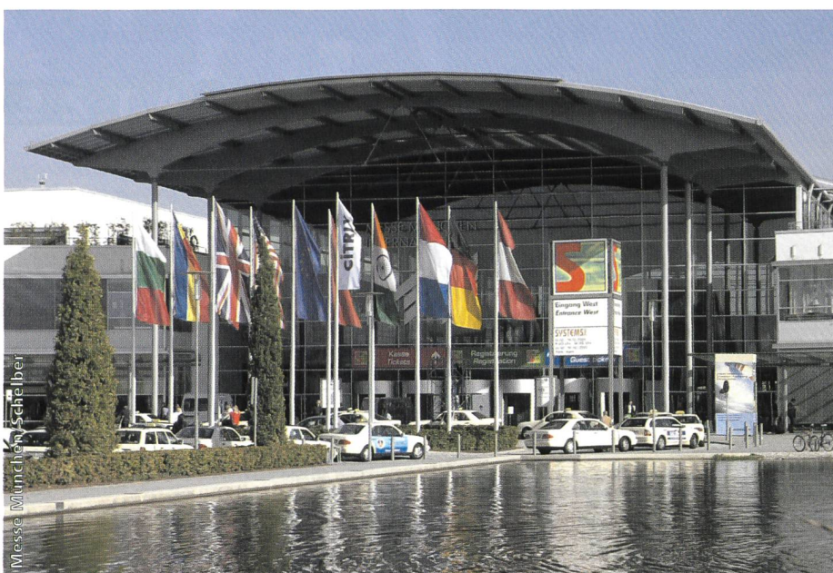
Bild 1. Um etwa 15% ist die Beteiligung an der «Systems 2001» gegenüber dem Vorjahr zurückgegangen. Dabei muss man aber berücksichtigen, dass die Messe im letzten Jahr noch in einer aussergewöhnlichen Boomphase stattfand.

Dass Sicherheit beim Nutzer anfängt, demonstrierte IBM mit dem neuen Security-ThinkPad T23. Dieser verfügt im Innenleben über einen Sicherheitschip, der Transaktionen im Internet bereits hardwaremässig verschlüsselt (Bild 3). Der Vorteil ist, dass der persönliche Zugangsschlüssel (Key) nicht verloren gehen