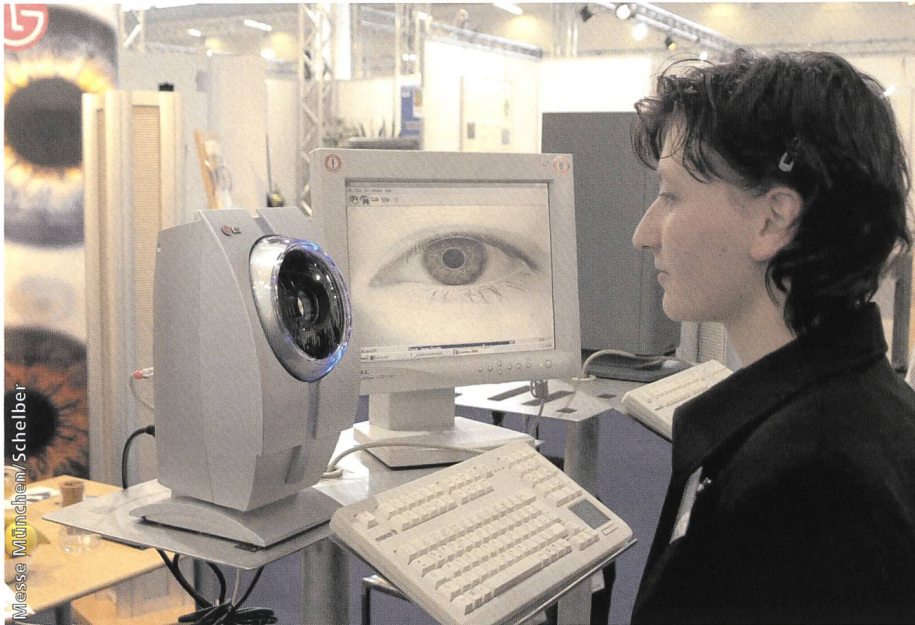
Bild 6. Eine Alternative zu Fingerabdruck ist die Iris-Erkennung. Sie ist noch sicherer, zumal sie keinen Kontakt zwischen Sensor und Auge erfordert.