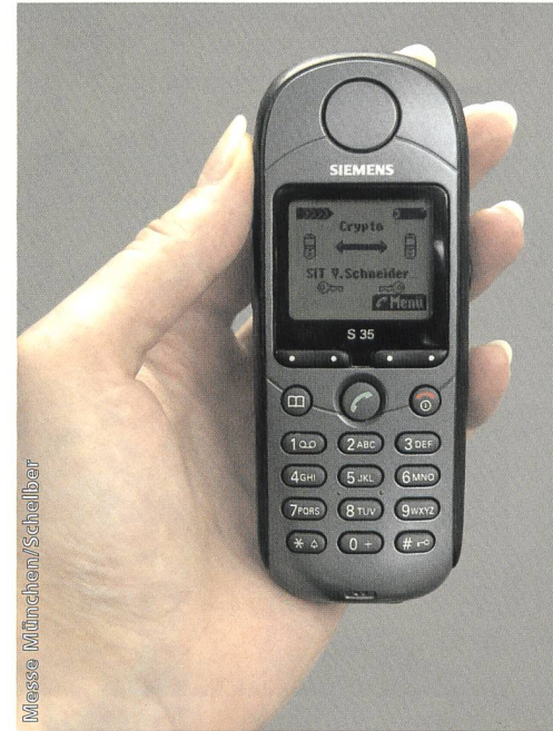
Bild 5. Erste Mobilfunkgeräte mit eingebauter Verschlüsselungstechnik waren auf der Messe zu sehen. Hier das S35 Crypto von Siemens.