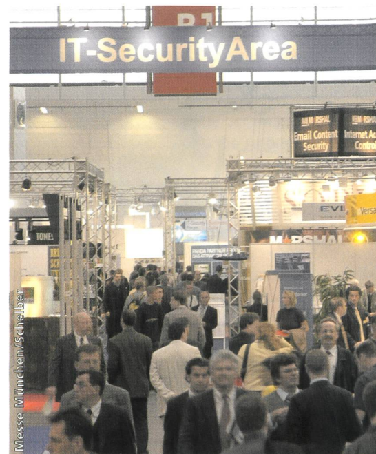
Bild 2. Ein trotz rückläufiger Konjunktur stark gewachsenes Thema auf der Messe in München war die IT-Sicherheit. Hier drängten sich die Besucher auch an schwachen Tagen.

Wir haben uns auf Felder fokussiert, die bei den Besuchern hoch im Kurs standen. Da ist zu allererst die Informationssicherheit zu nennen. Das hat viele Gründe: Selbst kleinen Unternehmen ist mittlerweile klar geworden, dass ihr Know-how die entscheidende Basis für künftige Geschäfte ist und dass man dieses Wissen sichern muss. Nachdem zum 1. Oktober der amerikanische Senat ein Gesetz verabschiedet hat (Combating Terrorism Act), welches das Abhören und