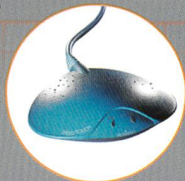
Alcatel SpeedTouch 330™ USB «plug and play»