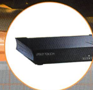
Alcatel SpeedTouch™ Pro Firewall Router mit Firewall