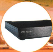
Alcatel SpeedTouch 570™ wireless Drahtlos ins Internet