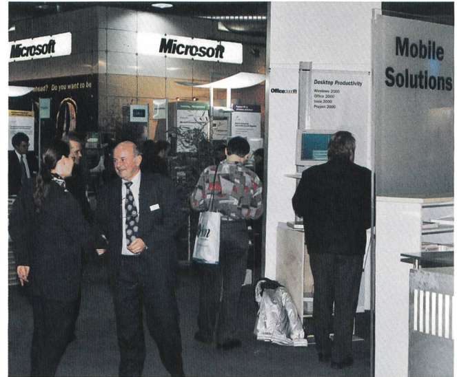
Bild 8. Mobile Solutions und XML – sogar bei Microsoft ein Thema.

Während 1999 noch 44% der Befragten das damals neu lancierte Wireless Application Protocol (WAP) für die bedeutungsvollste Einflussgrösse auf dem Schweizer Internetmarkt hielten, glaubten dieses Jahr gerade noch 5% daran. Stattdessen lag ASP zusammen mit «billigeren und einfacheren E-Commerce-Lösungen» mit je 41% auf dem Spitzenplatz der Nennungen.