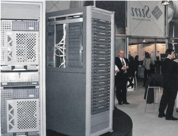
Bild 7. ...bleibt der Verkauf von Serverfarmen das Standbein von Sun.