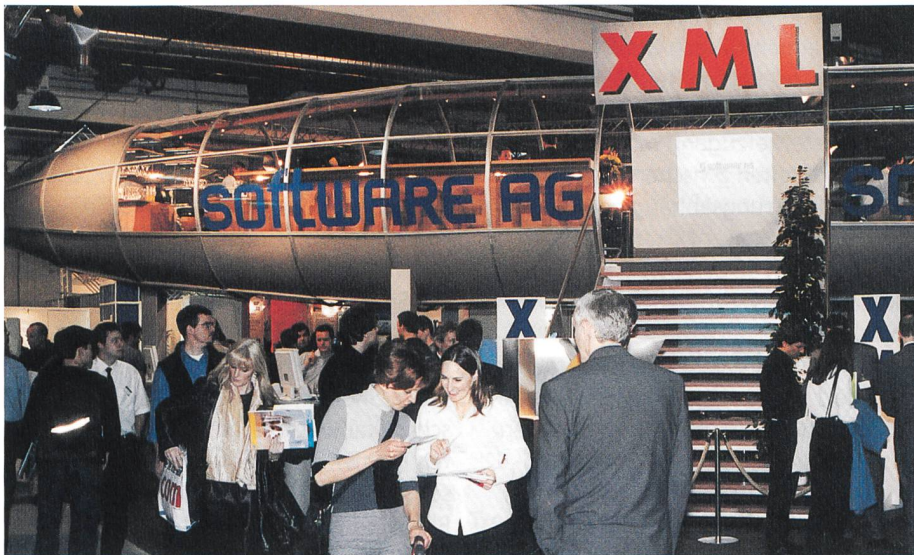
Bild 9. Das Luftschiff für VIPs am Stand der Software AG.

Alles in allem überzeugte die iEX 2001 in den meisten Punkten, sodass sich die Reise nach Zürich wie schon in den Vorjahren gelohnt hat – dies nicht zuletzt dank der hervorragenden Organisation seitens des Messeveranstalters. Er hat mit seiner hervorragenden Internet-homepage www.iex.ch , dem umfassenden WAP-Angebot und der vorbildlichen Besucher- und Pressebetreuung neue Zeichen gesetzt. 17