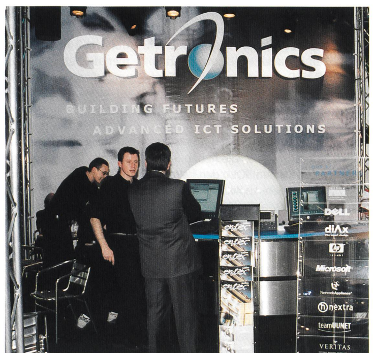
Bild 4. Geotronics, der führende Cisco-Reseller.