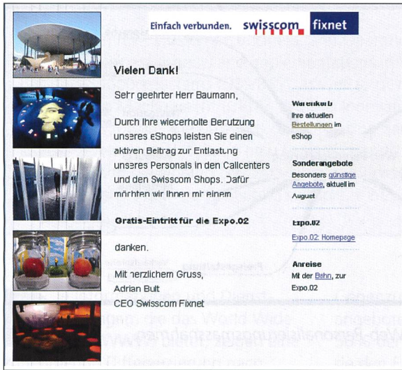
Bild 2. Unmittelbar nach dem Einkauf im E-Shop wird der Zielbenutzer (Person, die regelmässig im E-Shop einkauft) auf sein Kundengeschenk aufmerksam gemacht.