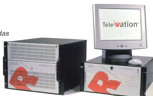
ALR TeleVation® 9025R

The CTI Company ALR Computer Telephony Integration Services Projects Distribution