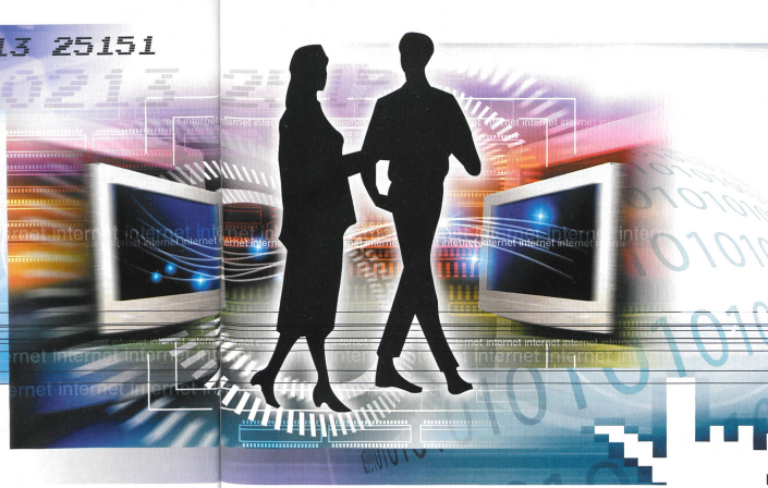
Bild 1. In Zukunft steht der Mensch mehr im Mittelpunkt als bisher, der Computer bedient also ihn und nicht umgekehrt.

enormes didaktisches Potenzial: So können etwa in den Bereichen Aus- und Weiterbildung oder E-Government vielfältige Lern- und Wissensinhalte effektiver vermittelt werden. Oder der Kunde eines virtuellen Kaufhauses erhält zu Hause oder per mobiles Endgerät eine bedarfsgerechte, individuelle Beratung und wird interaktiv durch vielseitige Marktplätze geführt.