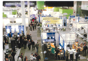
Bild 5. Beachtenswerte Pavillons aus Jordanien und Korea.