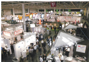
Bild 1. Genügend Freiraum auf der Orbit 2003.