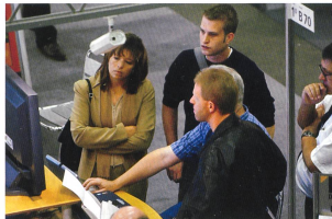
Bild 4. Intensive Gespräche im überschaubaren Rahmen – eine Stärke der Orbit 2003.