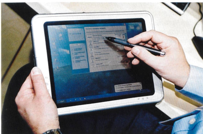
Tablett-PC von Compaq mit drahtlosem Internet-Zugang (PWLAN).