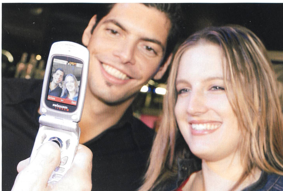
Bild 2. Mit dem Sharp GX20 lassen sich die Multimedienetze von Vodafone-live! perfekt nutzen.

Als erster Mobilfunkanbieter in der Schweiz bietet Swisscom Mobile die Möglichkeit, mit dem Handy Fotos zu schiessen und diese als Postkarte an jede Postadresse weltweit innerhalb weniger Tage zu verschicken. Die geschossenen Bilder lassen sich mit Ton und Text versehen und natürlich auch als MMS auf ein anderes MMS-fähiges Handy oder an E-Mail-Adressen verschicken. Alle Foto-Handys von Vodafone-live! verfügen über eine integrierte Kamera. Mit dem Sharp GX20 lässt sich ein Objekt sogar zoomen oder im Makromodus von ganz nahe fotografieren. Mithilfe des über Web oder Handy zugänglichen MMS-Albums können persönliche Bilder sicher abgespeichert und jederzeit mit dem Handy wieder aufs Farbdisplay abgerufen oder auf den PC-Bildschirm geholt werden. Das Album lässt sich mit eigens angelegten Ordnern praktisch verwalten. Das Angebot an Content und Services ist eine attraktive Mischung von globalen Topbrands (Simpsons, Ferrari Monte Carlo, UEFA, James Bond, Tomb Raider