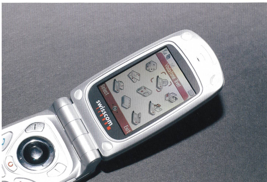
Bild 1. Handy Sharp GX20.

Töne: Eine Bandbreite von bis zu 16 Stimmen, verschiedenste Akustikeffekte und eine unvergleichliche Tonqualität sorgen dafür, dass das Handy wirklich einen persönlichen und individuellen Klang bekommt. Auf den Vodafone-live!-Handys sind verschiedene Rufmelodien voreingestellt. Darüber hinaus kann der Kunde Musikstücke in verschiedenen Kategorien auswählen – von Top-10-Songs, über aktuelle Neuheiten bis hin zu genrespezifischen Stücken aus Rock und Pop.