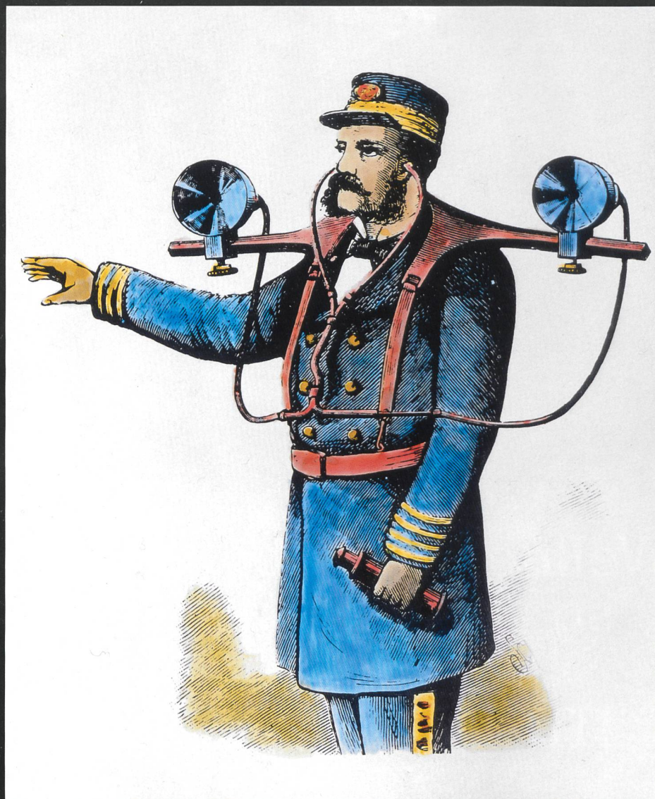
Stich von 1880, Bearbeitung und Kolorierung H. R. Bramaz, Zürich.

Professor Mayer's «Topophon» zur Tonspeicherung. Zur akustischen Schall-Lokalisation hatte man bereits im Jahr 1880 die Basis der Ohren durch ein Gerät vergrössert, das den Namen «Topophon» erhielt. Dieses patentierte Gerät ermöglichte es den Kapitänen, im Nebel die Richtung eines anderen Schiffes exakt zu bestimmen, das sich mit einem Nebelhorn bemerkbar machte.