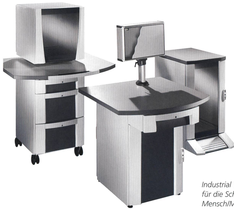
Industrial Workstations für die Schnittstelle Mensch/Maschine.

bereitet. Die Monitor- bzw. Bedienunggehäuse können auch direkt an einen Tragarm installiert oder mit einem dreiteiligen Pulssystem kombiniert werden. Das Bedienunggehäuse nimmt bei dieser Anwendung flache TFTs oder andere Anzeige- und Eingabeeinheiten auf. Diese können optional auch in das Bedienunggehäuse Optipanel integriert werden. Dieses ist mit der neuen IW-Serie kombinierbar. Zusätzlich können die Arbeitsplatten zum Ablegen von Tastaturen, Mouse, Scanner und weiteren Arbeitsmitteln und -plänen genutzt werden. Das Rittal IP-67-Mousepad und/oder eine Tastatur können direkt in die Arbeitsplatte eingelassen werden. Wird kein Unterschrank benötigt, so kann als Alternative ein Standfuss eingesetzt werden. Dieser lässt sich mit der kleineren Arbeitsplatte kombinieren, an deren Unterseite eine zu neigende Gehäusebefestigung für ein Optipanel verschraubt ist.