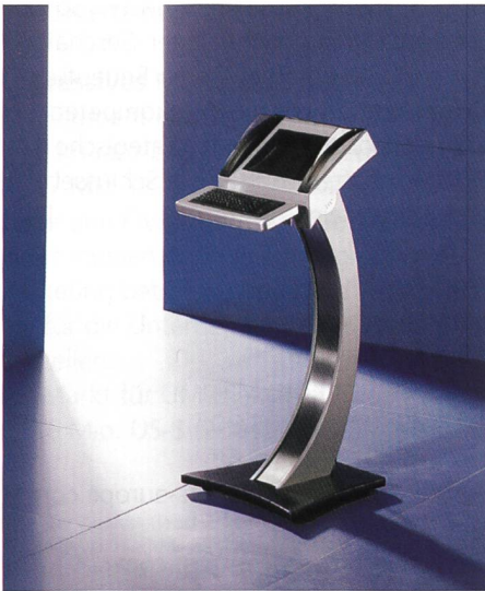
Das interaktive Terminalsystem «Alpha-Line».

Rittal sieht einen der Einsatzschwerpunkte für die interaktiven Terminalsysteme auf Messen. Jedoch nicht nur hier, sondern auch in Foyers von Unternehmen, als Mitarbeiterinformationssystem oder im Handel und bei Finanzdienstleistungen eröffnet sich eine Vielzahl von neuen, Kunden bindenden Anwendun-