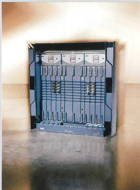
Multiservice Switching Platform ONS 15600

Mit der Multiservice-Switching-Plattform ONS 15600 erweitert Cisco sein Portfolio für optische Netzwerklösungen, COMET (Complete Optical Multiservice Edge and Transport). ONS 15600 ist für den Einsatz an Points-of-Presence (PoP) von Carriern und in grossen Unternehmenszentralen konzipiert und bietet zahlreiche Netzwerkfunktionalitäten in einer einzigen Komponente. Sie vereint Elemente verschiedener Metro-Systeme wie SONET/SDH-Multiplexer (Synchronous Optical Network/Synchronous Digital Hierarchy) und digitale Cross-Connect-Netzwerkbestandteile. Die Plattform wurde für TDM-basierende Dienste (Time Division Multiplexing) optimiert und kann gleichzeitig für die paketorientierte Datenübertragung eingesetzt werden. ONS 15600 nimmt aufgrund der hohen Port-Dichte weniger Stellfläche als herkömmliche Breitband-Cross-Connects ein. Mit dem Einsatz der Multiservice-Plattform profitieren Service Provider von neuen Umsatzpotenzialen sowie niedrigen Anschaffungs- und Lebenszykluskosten. Cisco hat zudem die Funktionalitäten der optischen Komponenten ONS 15454 und ONS 15327 sowie des Cisco Transport Manager (CTM) erweitert. Die optische Transportplattform ONS 15454 unterstützt Datenanwendungen, die Protection Channel Access zur Anpassung an steigenden Datenverkehr nutzen. Die ONS 15327 wurde um Gigabit-Ethernet-Fähigkeit und Ethernet-basierende Band-