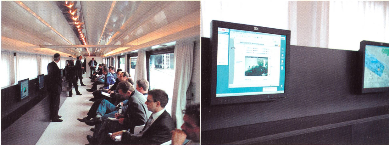
Insgesamt zwölf Flatscreens waren im umgebauten Eisenbahnwagen installiert.

Journalisten während der Fahrt beim Testen von «Mobile Unlimited».