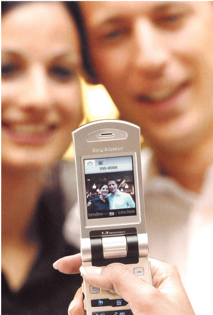
Bild 2. Die Handys wurden markant weiterentwickelt und haben sich vom einfachen Telefon zu einem multifunktionalen und multimedialen Endgerät gewandelt. Swisscom Mobile