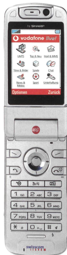
UMTS-Mobiltelefon Sharp V902 offen.

Bereits jedes vierte Handy, das bei Swisscom Mobile gekauft wird, ist ein UMTS-Handy. Die Nutzung der neuen Services wie Videotelefonie und Live-TV ist erfreulich. Jeder zweite UMTS-Kunde benutzt Live-TV. Zudem gibt es für alle Videotelefonie-Anwender eine gute Nachricht: Die Promotion für Videotelefonie (gleicher Preis für eine Minute Videotelefonie wie der bisherige Minutentarif für Sprachtelefonie) wird bis Ende Juni 2005 verlängert.