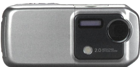
UMTS-Mobiltelefon Sharp V902 geschlossen.

(RS) Das exklusiv bei Swisscom Mobile erhältliche Sharp V902 ist das erste UMTS-Mobiltelefon in der Schweiz, das über eine 2-Megapixel-Kamera verfügt. Autofokus und optischer Zweifach- sowie digitaler Zehnfach-Zoom garantieren sehr gute Bilder in Druckqualität. Auch die Qualität der bewegten Bilder erreicht mit dem Sharp V902 ein bisher ungekanntes Niveau. Videotelefonie und Live-TV machen damit noch mehr Spass. Das Display besticht mit 265 000 Farben und 240x320 Pixel. Das «Vodafone live!»-Handy verfügt über einen integrierten MP3-Player, einen Scanner mit Barcode- und Schrifterkennung, 26 MB Speicherplatz und eine externe 32-MB-Speicherkarte. Das Sharp V902 ist für 699 Franken (mit NATEL®-swiss-Abonnement, 24 Monate) ab sofort in allen Swisscom-Shops und im Fachhandel erhältlich. Ohne Abonnement beträgt der Preis 1299 Franken.