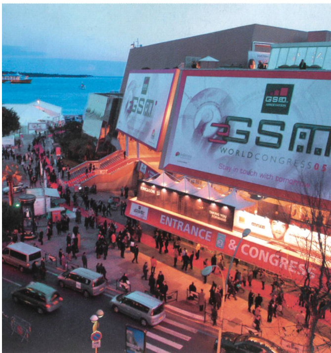
Feierliche Eröffnung des GSMA-Award.