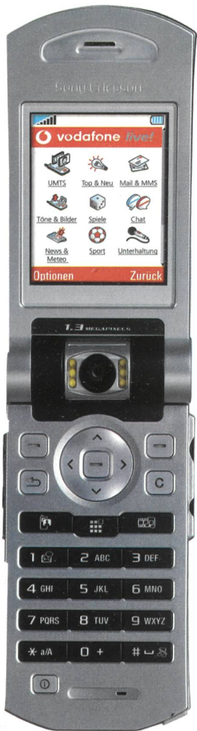
Bild 5. Sony Ericsson V800 – ein erfolgreiches UMTS-Handy mit «Vodafone-live!»-Funktionen.

ar durch die GSM Association (GSMA), der weltweit wichtigsten Vereinigung der Mobilfunkbranche, als Höhepunkt des GSM World Congress in Cannes verliehen. UMTS steht vielerorts noch mitten im Netzaufbau, bei vielen Betreibern jedoch bereits in der Bewährungsphase. Daher war es interessant zu sehen, welche Anbieter sich auf reine Netzdienste (Connectivity) beschränkten und wo eine intelligente Kombination verschiedener Übertragungstechniken bereits heute erhältlich ist. Und so waren Jury und Teilnehmer gleichermaßen gespannt, welche Endgeräte und mobilen Lösungen den besten Nutzen aus den neuen Netztechnologien ziehen.