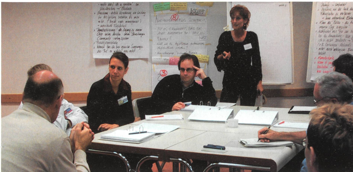
Angeregte Gespräche über Risiken von «smarten» Alltagswelten an einem dreitägigen Workshop der Stiftung Risiko-Dialog.

statt. Fragestellung und Teilnehmerkreis führten dazu, dass intensiver über die potenziellen Gefahren als über die Chancen debattiert wurde. Dies dürfte allerdings auch den öffentlichen Diskurs spiegeln: Falls Pervasive Computing zum öffentlichen Thema wird, dürften die Risikodebatten die Chancendiskussionen wohl überlagern.