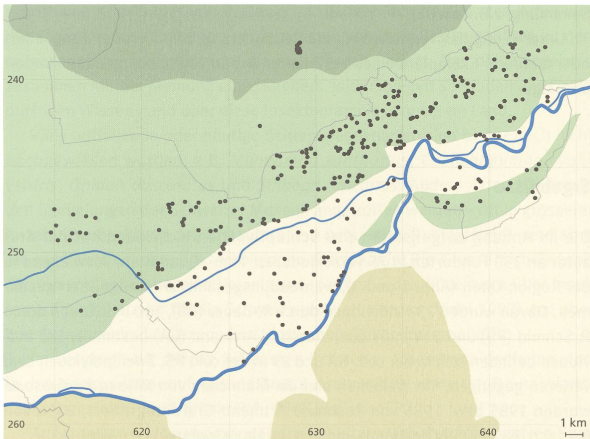
Abb. 3: Die Fundorte von Schlupfwespen in der Region Olten.