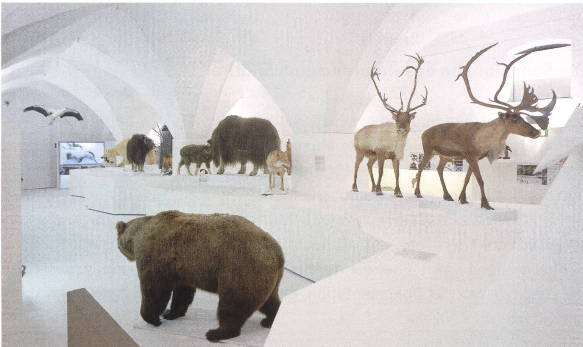
Abb. 6. Die Ausstellung "Winterspeck und Pelzmantel" wurde in Zusammenarbeit mit dem Naturmuseum in Olten (CH) organisiert. Dazu wurden Teile der historischen Architektur umbaut.

Durch die mannigfache Tätigkeit und die sich daraus ergebende regelmäßige Präsenz in den Medien hat sich das "junge" Museum zweifelsohne bei der Bevölkerung etabliert, sodass sich die Besucherzahlen der Ausstellungen seit dem Jahr 2000 mehr als verdoppelt haben und im Jahr 2008 erstmals die 70000-Marke "geknackt" wurde (siehe Abbildung 7). Insgesamt haben im