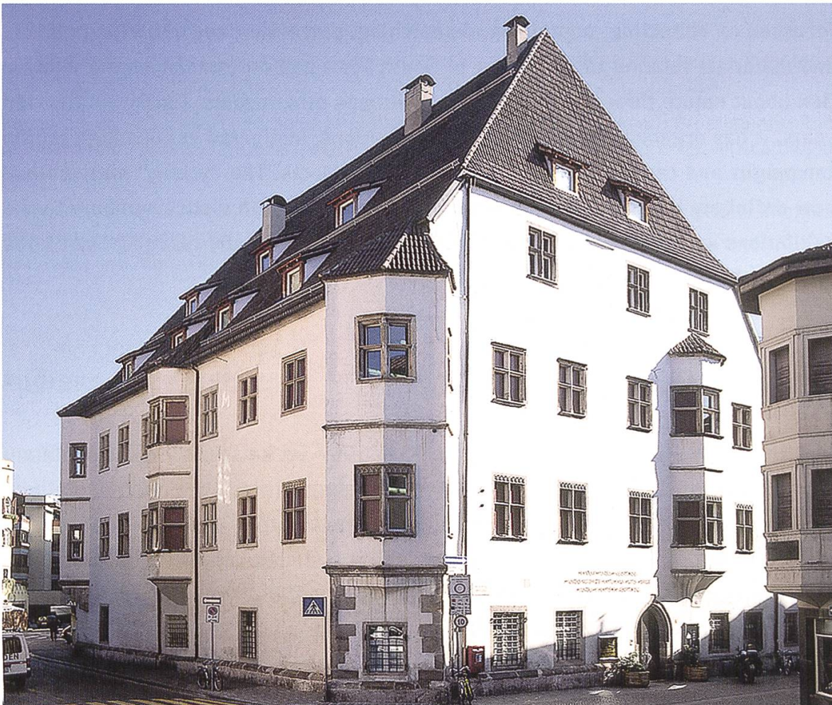
Abb. 1. Das Naturmuseum Südtirol hat seinen Sitz im denkmalgeschützten "Landesfürstlichen Amtshaus" in der Bindergasse in Bozen. Hier wurde möglicherweise schon im Jahr 1363 der Vertrag zwischen Margarethe Maultasch und Herzog Rudolf IV unterzeichnet, nach dem Tirol den Habsburgern vererbt und ein Teil von Österreich wurde.

Seit seiner Gründung beschäftigt sich auch das Naturmuseum Südtirol mit dem Sammeln, Ordnen, Erforschen, Konservieren und Ausstellen von Gegenständen und Materialien zur Natur des Landes Südtirol sowie mit der Vermittlung von Kenntnissen über die Natur des Landes Südtirol im Rahmen von Ausstellungen und diversen Veranstaltungen. Die Forschungstätigkeit beinhaltet dabei auch die Durchführung, Förderung und Veröffentlichung von Studien und Forschungsarbeiten.