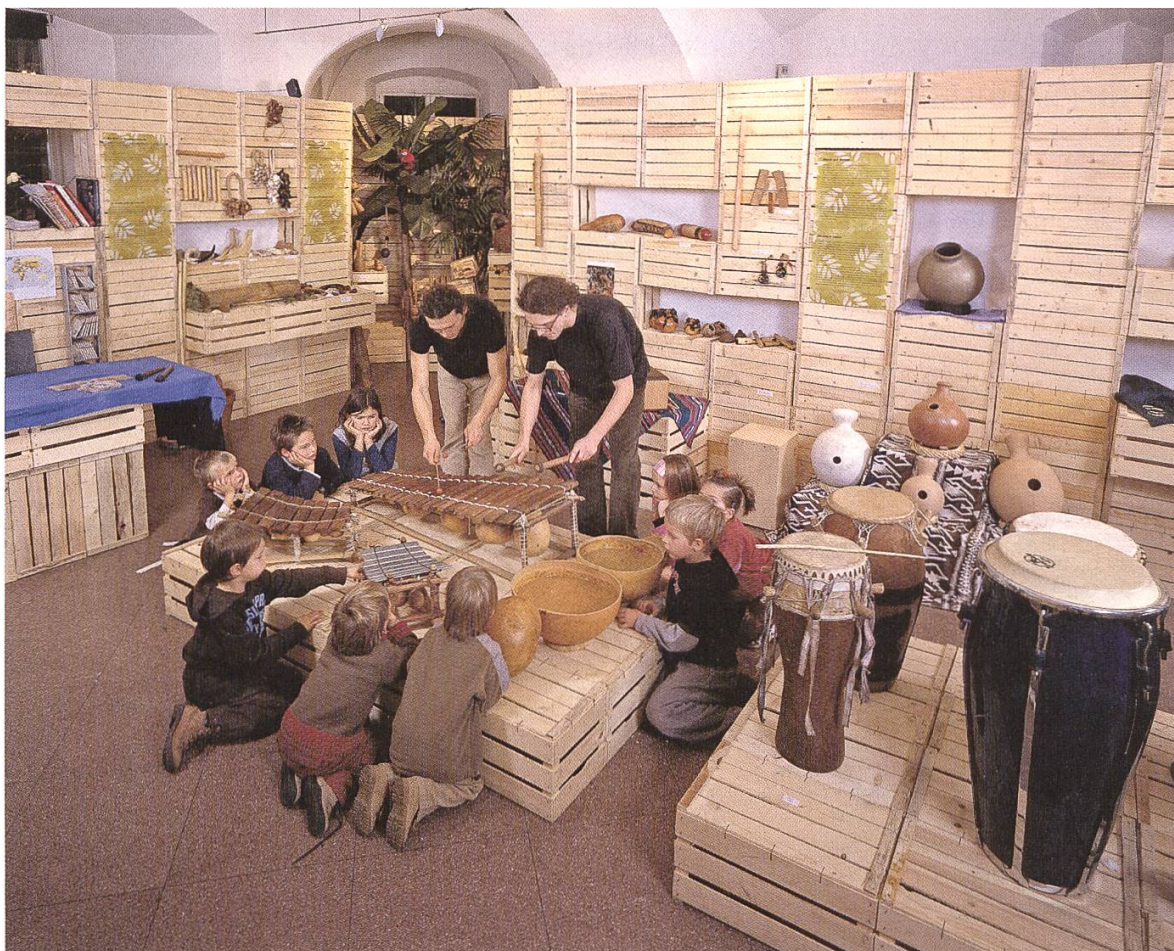
Abb. 5. Durch ein reiches Programm an Sonderausstellungen konnte das Naturmuseum die Besucherzahlen seit dem Jahr 2000 verdoppeln: Die Ausstellung "Rhythm & Nature" verdeutlichte die Verwendung von Naturmaterialien für die Klangerzeugung.

Parallel dazu wurde von der Gründung des Museum bis heute ein besonderes Augenmerk auf die Durchführung von wissenschaftlichen Projekten mit der