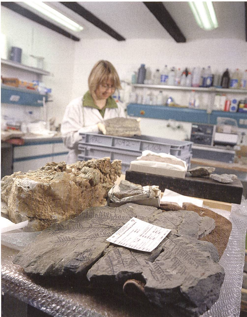
Abb. 8. Wissenschaftliche Untersuchungen an den Fossilien der Dolomiten geben Auskunft über die klimatischen Verhältnisse im Dolomitengebiet vor 200 Millionen Jahren. Die Forschungsergebnisse werden in den museumseigenen und in internationalen Fachzeitschriften veröffentlicht.

In einer Zeit, in der sich weltweit Universitäten und Forschungsinstitute häufig von den klassischen Betätigungsfeldern der Naturkunde zurückziehen, ändern sich auch die Schwerpunkte der Museen. Diesen kommt nicht nur eine immer grössere Verantwortung im Hinblick auf die Verwahrung naturkundlicher Objekte zu. Auch deren Bestimmung und Klassifikation rückt immer mehr in ihren alleinigen Kompetenzbereich. Diese Verantwortung hat das Naturmuseum bald nach seiner Gründung als Chance erkannt und von Beginn an auf systematische Forschungsarbeit gesetzt. So ist das Museum inzwischen Garant und Ansprechpartner, wenn es um das einheimische Naturinventar geht. In den ersten 10 Jahren seiner Tätigkeit hat das Naturmuseum ein breites Netz an wissenschaftlichen Kooperationen aufgebaut und versucht auch seiner Aufgabe als Ort der Forschung gerecht zu werden.