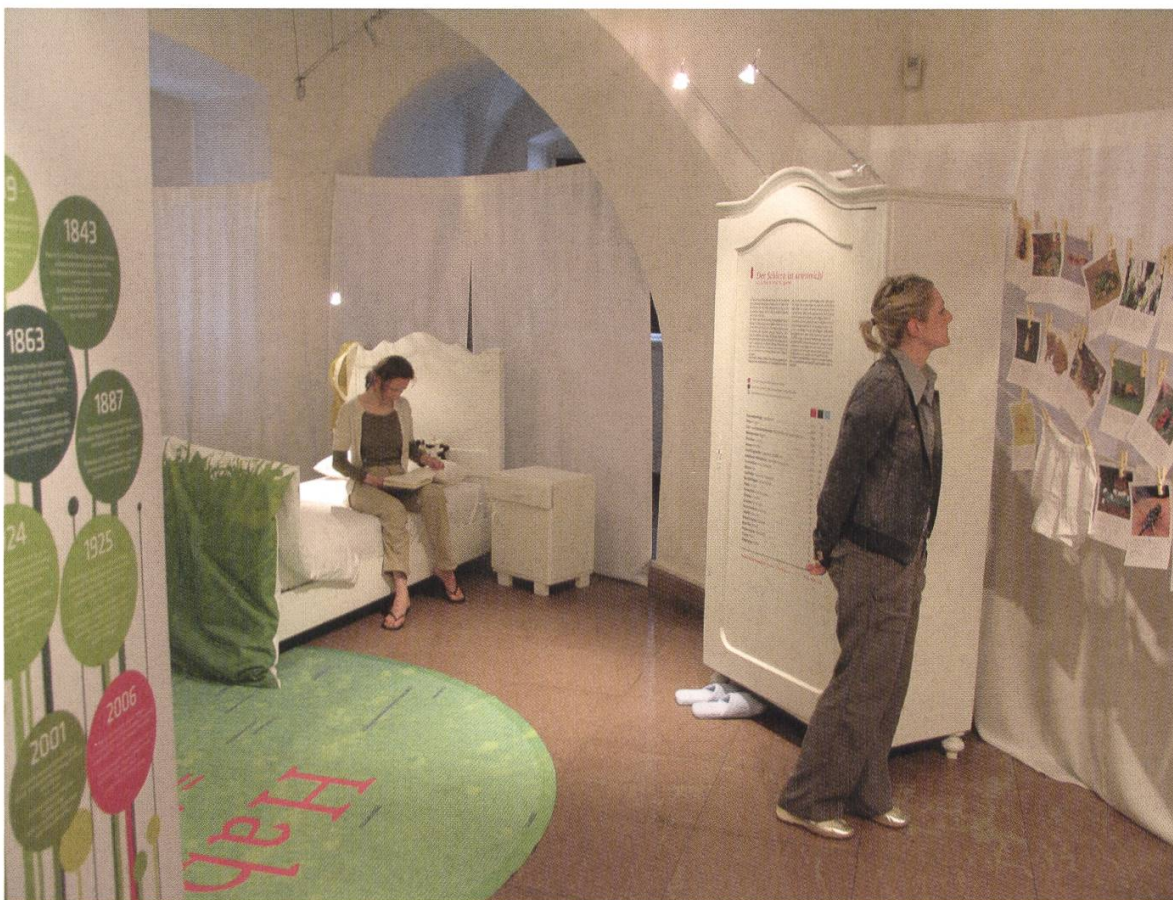
Abb. 9. Die Ergebnisse von Forschungsprojekten finden vermehrt Niederschlag in reizvoll inszenierten Ausstellungen: Im Rahmen des Forschungsprojektes "Lebensraum Schlern" wurden über 5000 verschiedene Tier- und Pflanzenarten registriert, 450 waren neu für Südtirol.