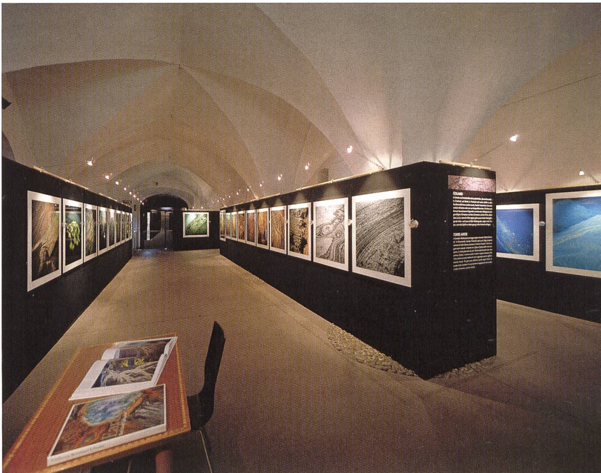
Abb. 10. Fotoausstellungen sind während der Sommermonate bei Einheimischen und Touristen sehr beliebt: Die Fotoausstellung "Earthsong" von Bernhard Edmair im Sommers 2006.

Das Museum gibt selbst zwei jährlich erscheinende Fachzeitschriften heraus. Die 2001 gegründete Fachzeitschrift "Gredleriana" ist ein Medium zur Publikation von Ergebnissen naturwissenschaftlicher Forschung in Südtirol aus den Fachbereichen Botanik, Zoologie und Ökologie. In Zusammenarbeit mit dem Institut für Geologie und Paläontologie der Universität Innsbruck gibt das Museum seit 2004 auch die Zeitschrift "Geo.Alp" mit Arbeiten über alpine Geologie heraus.