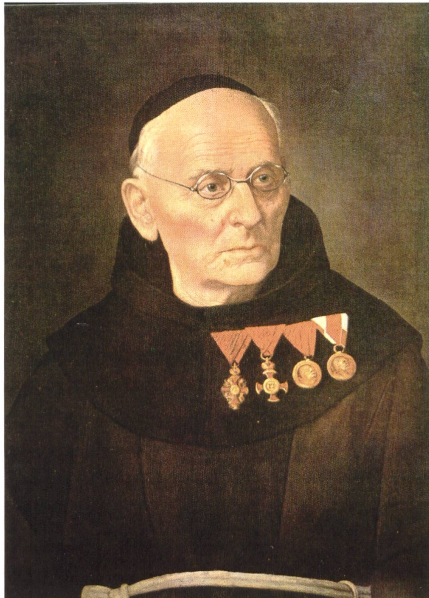
Abb. 2. Der Franziskaner Pater Vinzenz Maria Gredler berichtete im Jahr 1851 über die "Die wissenschaftlichen Zustände Tirols". Von ihm gingen entscheidende Impulse für die naturwissenschaftliche Erforschung des Landes aus.

Die Dauerausstellung eröffnete im Herbst 1999. Seitdem hat sich das Museum stetig weiterentwickelt und ist fortdauernd darauf bedacht, seinen statutarisch festgelegten Aufgaben gerecht zu werden. Das Naturmuseum hat sich in der Südtiroler Museumslandschaft inzwischen etabliert und konnte so ein dichtes Verbindungsnetzwerk zu Personen und Institutionen im In- und Ausland aufbauen. Diese "Jugendphase" war durchaus durch eine gewisse Flexibilität gekennzeichnet, da man die eigenen Schwerpunkte, auf die lokalen Bedürfnisse und Gegebenheiten angepasst, noch recht frei definieren konnte. Dennoch lastete auf dem Museum von Beginn an auch das Erbe eines in den vergangenen Jahrhunderten in Südtirol fehlenden Museums im Bereich Naturkunde. Zu Beginn des 20. Jh. brach die Erkundung des Südtiroler Naturinven-