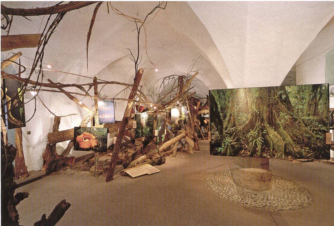
Abb. 3. Im gotischen Sonderausstellungsraum des Naturmuseums lässt sich mit Phantasie und Geschick auch ein tropisches Ambiente schaffen: Die Fotoausstellung "Jungles" von Frans Lanting.

Die Idee eines Museums im "Maximilianischen Amtshaus" reicht weit zurück. Bereits 1898 hatte der "Museal-Verein Bozen" die Anfrage um "Überlassung des früher als Postgebäude benützten alten Regierungsgebäude für Museal-zwecke" an das Finanzministerium in Wien gerichtet. Dieser Antrag wurde aber "aus Gründen der eigenen Erfordernisse der Regierung" abgelehnt. Während des Faschismus ging das Amtshaus in den italienischen Staatsbesitz über. Noch bis in die 1970er Jahre waren im Erdgeschoss staatliche Verwaltungen wie das Finanzamt und das Eichamt untergebracht. Ausserdem wurden im ersten und zweiten Stock die Räume unterteilt und in zahlreiche Wohnungen eingeteilt.