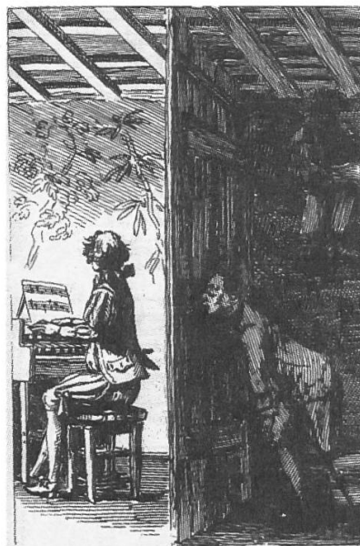
Illustration pour Le Diable amoureux Édition originale, Paris, Le Jay, 1772

Cette qualité de regard se retrouve presque naturellement dans l'utilisation généralisée de l'oxymore dont on a pu voir qu'il constituait l'un des procédés médiateurs les plus puissants du fantastique. Le décor privilégié du conte traduit visuellement la conjonction de ces forces contraires élémentaires que sont la lumière et les ténèbres. Des Nachtstücke de Hoffmann à Saint-Judas-de-la-Nuit de Jean Ray en passant par Gaspard de la Nuit , Nocturnal de Franz Hellens ou même les Poèmes nocturnes , titre que Baudelaire envisagea un instant de donner à son Spleen de Paris , 45 les jeux du clair-obscur conviennent aussi bien au poème en prose qu'au conte fantastique. Or s'il en va de la sorte, c'est bien parce que l'œuvre s'inscrit dans une tradition picturale qui se plaît à