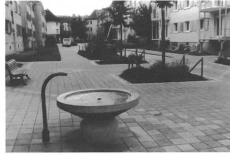
Wohnstrasse 1992: früher und heute