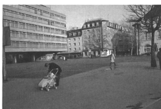
Rarität: Raum zum Atmen...