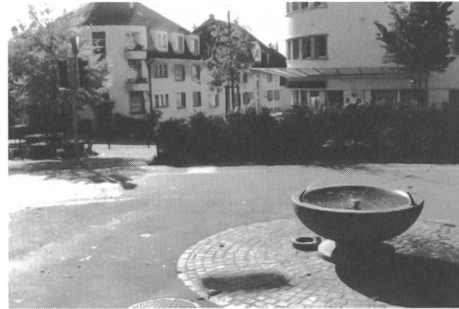
Rückgewinnung von Fussgängerfläche: früher und heute