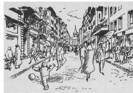
—und als Fussgängerzone