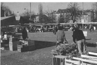
...aber auch für Aktivitä- ten und Kommunikation!