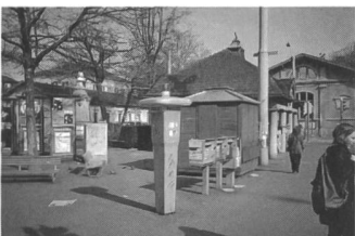
...oder permanent gefüll- ter Raum?