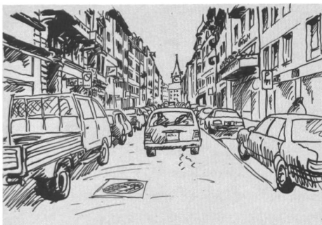
Rennweg heute ...

Les différentes utilisations de l'espace public exercent des pressions énormes sur l'espace urbain, au point d'engendrer la menace d'une véritable asphyxie. C'est le devoir des professionnels de trouver la juste mesure des aménagements nécessaires pour tirer le meilleur parti de cette ressource limitée qu'est l'espace public des villes suisses. La juste mesure ne réside pas forcément dans des projets prestigieux, mais dans la modestie d'aménagements conçus pour répondre avant tout aux besoins sociaux des habitants.