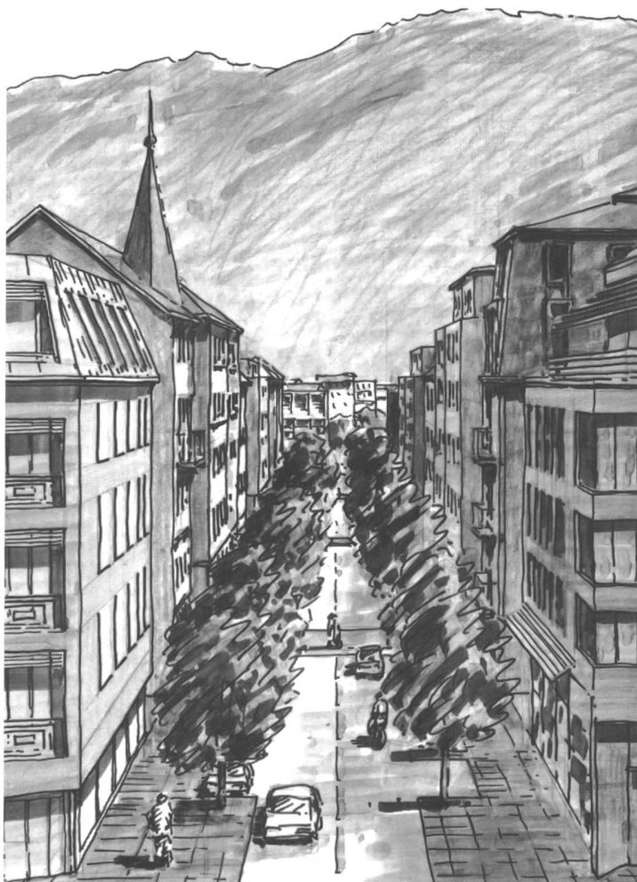
Etudes de paysage et d'ambiances urbaines

vail" créé afin d'expliquer le monde qui cache plus de mystères qu'il n'en révèle d'évidences. Seulement, à un moment donné, le modèle est devenu compliqué autant que le contexte qu'il voulait expliquer et a eu besoin, à son tour, d'un outil d'explication plus simple sous la forme de "plan", "stratégie de développement", "schéma directeur" ou "politique urbaine". C'est à ce moment précis que l'urbanisme a fait son apparition. C'est davantage qu'une évidence que la profession d'urbaniste échappe à une définition claire. Cet "faiseur de pluie" des temps modernes est censé connaître la construction, le territoire, le futur, la politique, la gestion, la communication, la négociation, sans être vraiment marqué par un de ces domaines. En fait, le travail d'urbaniste consiste à observer, écouter, mettre en relation, comparer, peser, évaluer, imaginer, rassembler, prévoir, signaler, avertir... Tout en s'appuyant sur le passé, il scrute le présent afin d'esquisser l'avenir. Il y a peu d'activités qui lui ressemblent. Parmi celles-là, le job de l'augure lui est peut-être le plus proche. Chacun de ces deux professionnels fait appel aux techniques les plus performantes dont il a la connaissance. Si l'augure examine le foie des animaux de la région, l'urbaniste analyse "les données à référence spatiale", si l'augu-