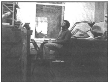
Bilder von Matt Mullican "Performance under hypnosis"

Aufgrund der wachsenden Zahl der Überforderten wird eine zunehmende Bevölkerungsminderung zur Beschäftigungslosigkeit bzw. zu fremdbestimmter Niedriglohnarbeit gezwungen sein. Die Franzosen haben dafür den Begriff der «tiersmondialisation» geprägt, der besagt, dass sich eine Art Dritter Welt in unseren Grosstadttagglomerationen ausbreitet. ■