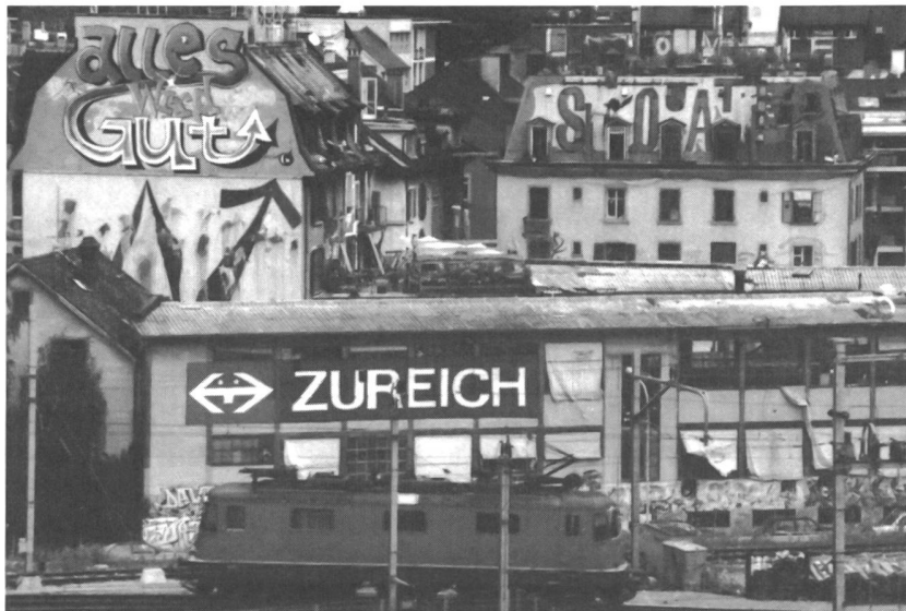
Wohlgroth-Areal, Zürich. Zwischengenutzt 18.5.91 - 23.11.93.

Trotz eines integrativ- undogmatischen Ansatzes, der sich auf ein entwicklungs-offenes Vorgehen ausrichtet, strebt KraftWerk 1 dabei die dauerhafte Übernahme des brachliegenden Bodens an, eine langfristige Neustrukturierung. KraftWerk stösst also zwar in eine Nische vor, möchte sie aber endgültig benisten - nicht als Zugvogel. Aus der Brache würde so wieder ein Stück stabiles Stadt- und Wirtschaftsgewebe. Solch endgültiges Neufüllen der Leerräume zielt also auf einen verbesserten, aber wiederum statisch geplanten Zustand der Stadt.