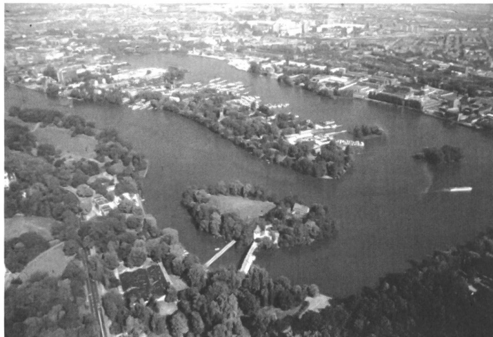
Blick auf die Rummelsburger Bucht stadteinwärts

Im Bereich der Halbinsel Stralau, in dem bereits mit den Baumassnahmen begonnen wurde, geht das städtebauliche Konzept auf Prof. Hermann Hertzberger, Amsterdam zurück. Merkmal ist eine vielfältige Zeilenbebauung, die die städtische Präsenz des Wassers beidseitig der Halbinsel erlebbar macht. Im Wohnungsneubau stellt eine aus-