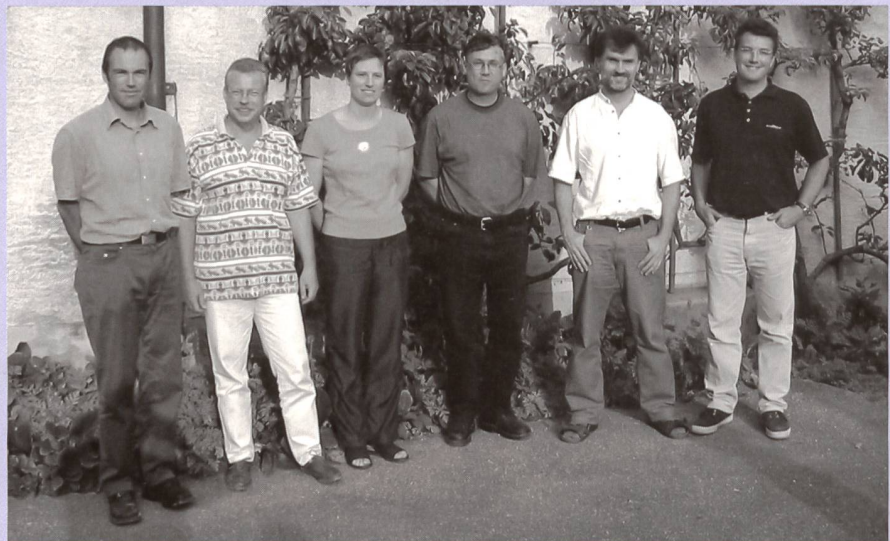
Foto neuer Vorstand