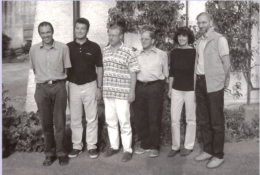
Foto alter Vorstand

Viel Spass und Erfolg! dem neue Vorstand des FSU Sektion Bern, ab 25. Juni 2002: