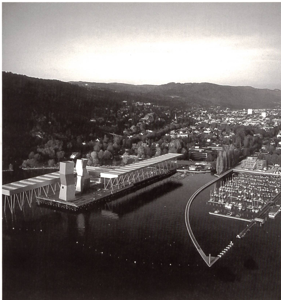
Arteplage Biel mit dem neuen Kleinboothafen