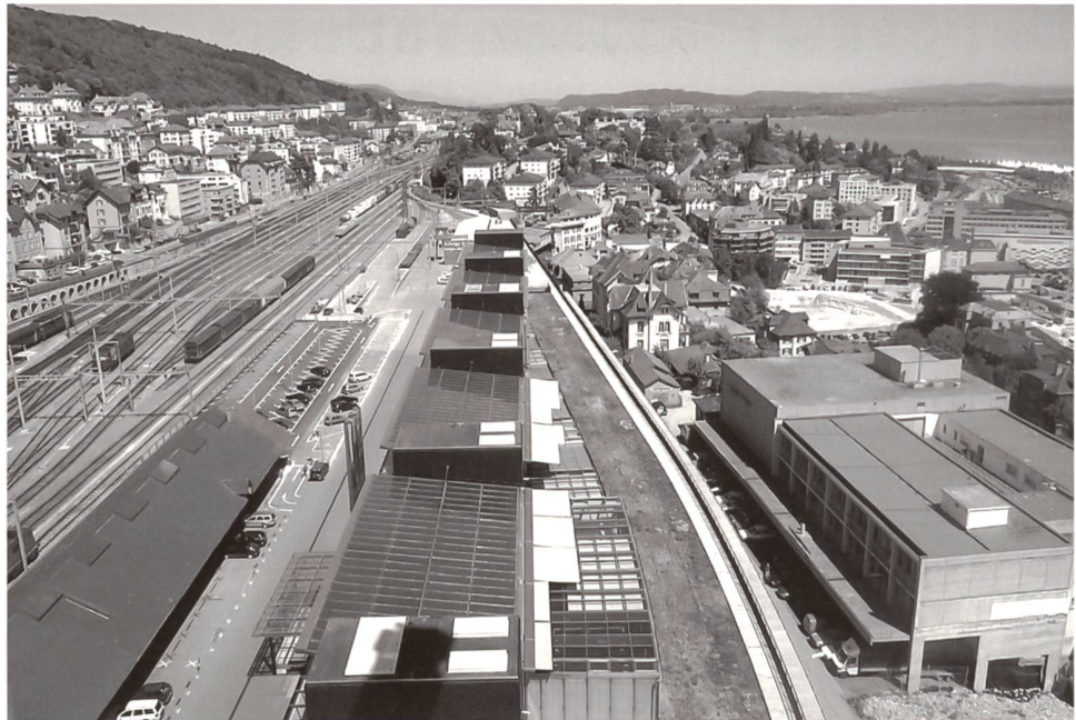
Vue du quartier depuis la tour de l'OFS, actuellement en construction

Ein zentrales Handlungsfeld besteht in der Vernetzung der verschiedenen Partner im betroffenen Gebiet durch ein eigentliches «Coaching»: es umfasst den Ausbau der Beziehungen unter den Grundeigentümern, die Entwicklung von Gesamtkonzepten und das Projektmarketing durch Kommunikationsarbeit und Investorensuche. Das Projekt hat so nicht nur des Entwicklungspotential des Gebiets aufgezeigt, sondern als sein Katalysator gewirkt, indem ein gemeinsames Ziel für alle Partnern formuliert wurde. Der Wille zur Innovation und der Grundsatz einer nachhaltigen Entwicklung haben dem Prozess eine zusätzliche Sichtbarkeit gegeben. Solche über die übliche städtebauliche und architektonische Planung hinausgehende Leistungen scheinen bei Projekten einer gewissen Größe, die eine bedeutende Zahl von Akteuren einbeziehen, angebracht. Sie werden insbesondere durch die spezifische Komplexität einer Operation diktiert und sollten bei der Formulierung von öffentlichen und privaten Aufträgen verstärkt berücksichtigt werden.