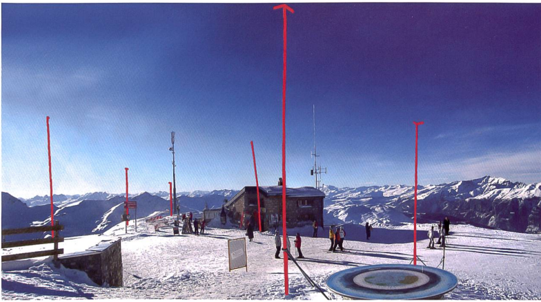
Neubau-Projekt auf dem Arosler Weisshorn

durch: Forum Landschaft, Institut für Landschaft und Freiraum HSR