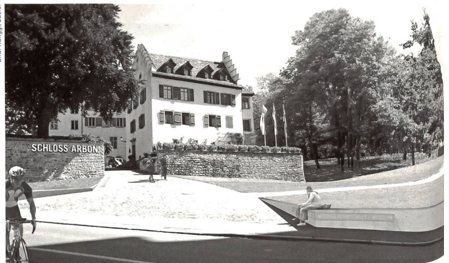
Schloss Arbon: Blick auf den künftigen Eingang zum Schloss und zum Schlosshügel