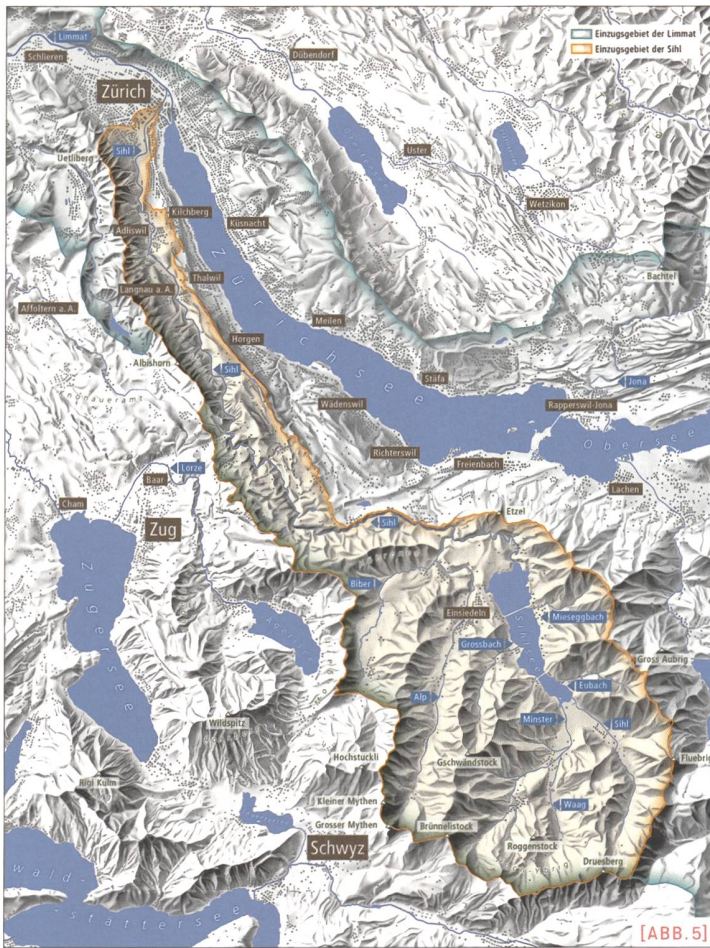
[ABB. 5] Einzugsgebiet der Sihl (orange) und Einzugsgebiet der Limmat (mint) mit den jeweiligen Zuflüssen. (Grafik: O. Lüde, Winterthur; Quelle: Bundesamt für Landestopografie)

Das Konzept «Kombilösung Energie» weist gegenüber dem «Entlastungsstollen» eine weit höhere Komplexität auf, weil unterschiedliche Anliegen wie Hochwasserschutz und Energieproduktion aufeinander abgestimmt werden müssen und eine Vielzahl an Projektpartner involviert sind. Daher ist beim Konzept «Kombilösung Energie» mit einer längeren Planungs- und Realisierungszeit von rund 15 bis 20 Jahren zu rechnen. Der Mehrwert, welcher mit diesem Konzept durch die gesteigerte Energiegewinnung erreicht werden kann, ist jedoch hoch. Als «multifunktionale» Anlage in einem dicht genutzten Siedlungs-, Natur- und Erholungsraum kann damit eine angestrebte optimierte Nutzung von bestehenden Infrastrukturanlagen und Ressourcen erreicht werden.