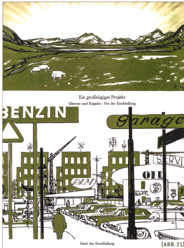
[ABB. 21] ... Interpretationen zu deren zukünftiger Entwicklung.

Der Raumplaner entwickelt sich immer mehr Richtung Koordinator, Kommunikator und Manager. Einerseits ist das hilfreich in der Projektentwicklung und für die Projektumsetzung. Andererseits ist dies auch mit Kreativitätsverlust unter den Raumplanungsfachleuten verbunden. Die verfliegende Kreativität und der Mut zu unkonventionellen, aber sinnvollen und zukunftsfähigen Lösungen vermisse ich weiterhin unter den Raumplanungsfachleuten, die sich teilweise weiterhin als «Verwalter» hinter Gesetzen, Vorschriften und Regeln verschanzen.