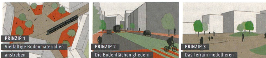
[ABB. 3] Die 13 Prinzipien aus der Planungshilfe Klangqualität für öffentliche Stadt- und Siedlungsräume.