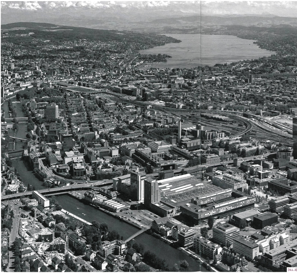
ILL. 2] Vue aérienne du centre de Zurich. De la gare à la cathédrale: espace de dialogue entre densification et patrimoine.